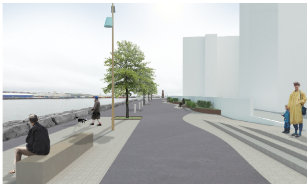
Norðurbakka til lengri tíma lítið.

Framkvæmdin er undanfari frekari uppbyggingar og framkvæmda við Strandstíginn og útivistarsvæði á Norðurbakka og við Norðurgarð. Teiknistofan Landslag og Strendingur verkfræðipjónusta eru ráðgjafar við undirbúning og hönnun verkefnisins f.h. Hafnarfjarðarhafnar og umhverfis- og skipulagssviðs Hafnarfjarðarbæjar.